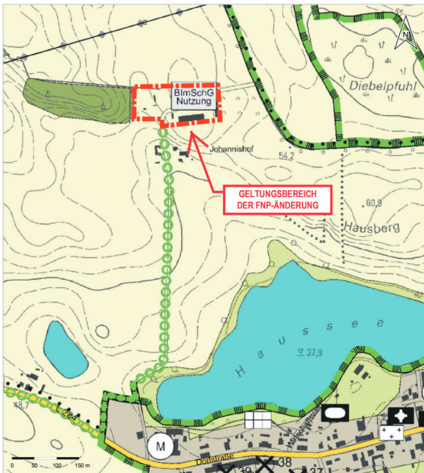
Auszug aus der Planzeichnung zum wirksamen Flächennutzungsplan mit Kennzeichnung des Geltungsbereiches der geplanten FNP-Änderung (rote Markierung/unmaßstäblich) © Stadt Schwedt/Oder 2023 | © GeoBasis-DE/LGB 2023, dl-de/by-2-0