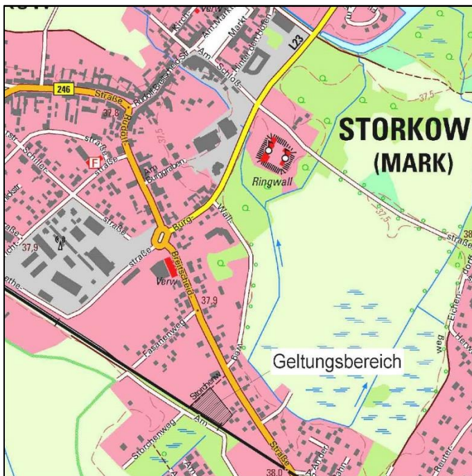
Übersichtsplan mit Verortung des Plangebiets zum vorhabenbezogenen Bebauungsplan „Wohngebiet Storchenvogel“ (ohne Maßstab), © GeoBasis-DE/LGB (2024), dl-de/by-2-0